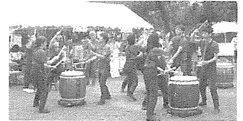
迫力の演奏 大塚太鼓

6月5日(日)梶ヶ谷第一公園で、恒例の「ふくしままつり」が開催されました。生産者模擬店、ワーカーズ模擬店、地場野菜、子どもコーナー、バザー、フリーマーケット、そしてイベント。イベントでは、大塚太鼓を皮切りに、洗足学園学生の金管五重奏、大型紙芝居、ビンゴゲームなど、盛りだくさんでした。