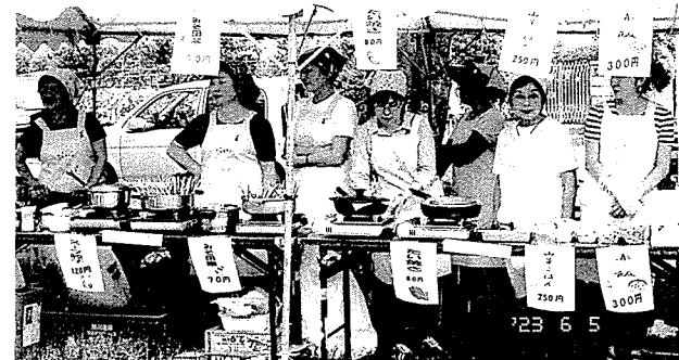
「ほほえみ」メンバーは黄色いエプロンで模擬店大忙し

組合員の皆様、当日ご来場下さった皆様、そしておまつりを盛り上げて下さったグループの方々、たくさんカンパやバザー品の提供を頂きありがとうございました。義援金は、赤十字社を通して被災された方々に、またまつり収益金は、福祉車両の購入に充てさせていただきました。心より感謝申し上げます。